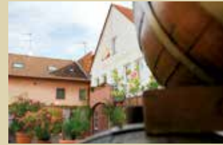
Vinothek und Weinkeller in Groß-Umstadt